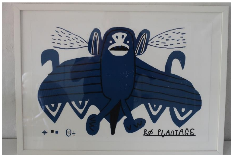
16. Søren Behncke, grafisk arbejde "Rø plantage"