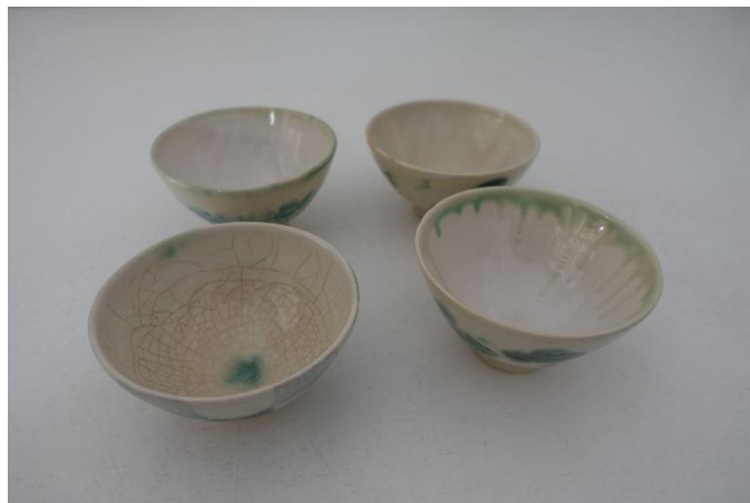
2. Fumi Moriyama, 4 små keramiske skåle