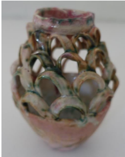
14. Helle Bovbjerg, flower power vase, grøn