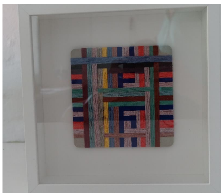
19. Astrid Skibsted, vikleprøve og bog