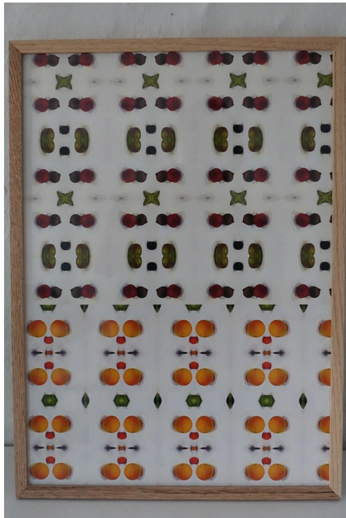
8. Bodil Sohn, tapet, inkjet print "TRAUN"