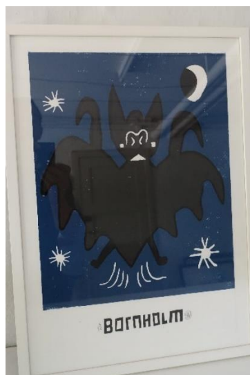
17. Søren Behncke, grafisk arbejde "Bornholm"