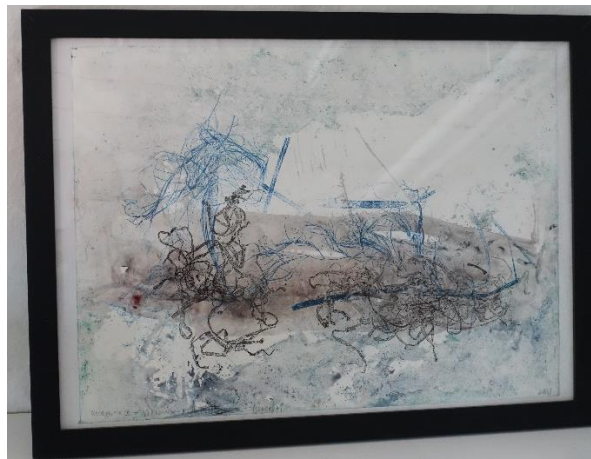
10. Lis Wuisman Jørgensen, monotypi