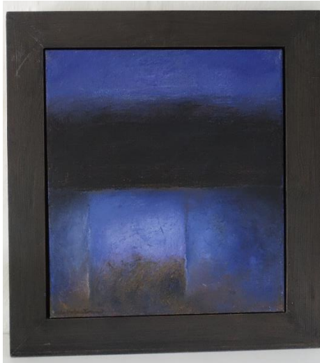
1. Ulla Holmstrand, Maleri "Ljus fokus"