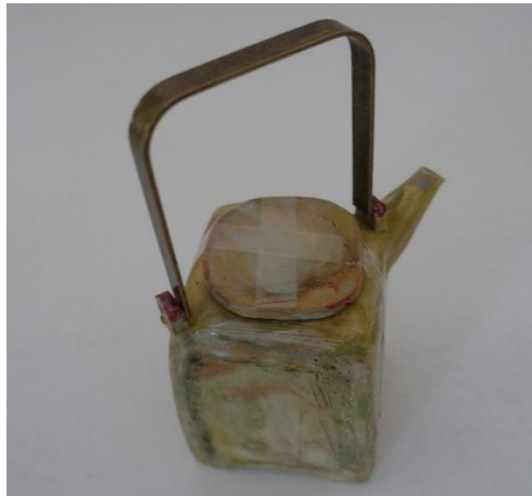
15. Helle Bovbjerg, tekande med messinghank