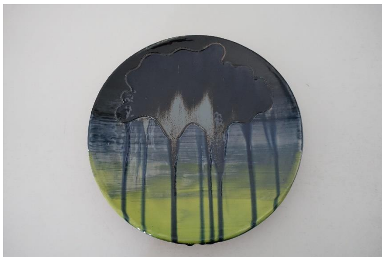
5. Gunhild Rudjord, keramisk fad