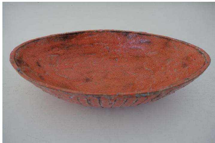
3. Bjarni Sigurdsson, keramisk fad