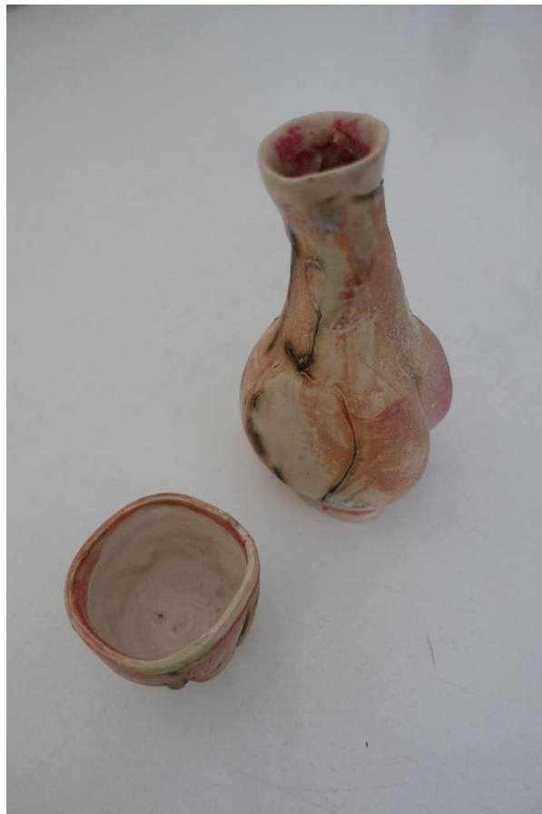
13. Helle Bovbjerg, sake flaske og drikkeskål