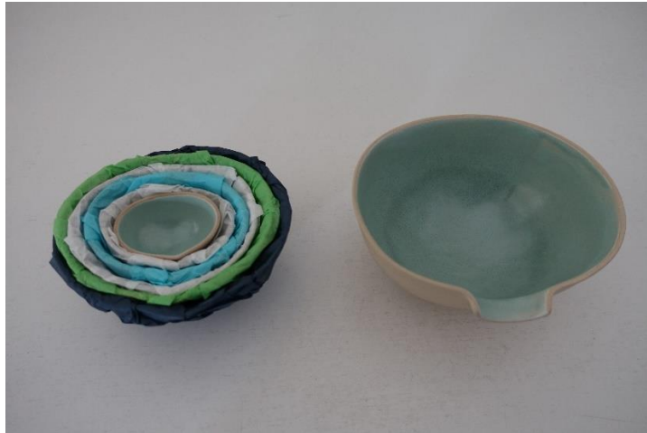
4. Grethe Westh, keramiske "løgskåle"