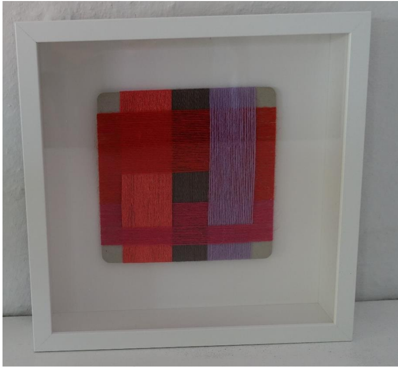
20. Astrid Skibsted, vikleprøve og bog